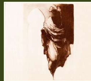
El Collar de la Coloma 2022