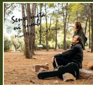
Sense meta ni rumb 2018