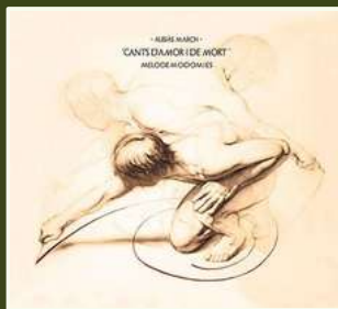
Cants d'amor i de mort 2017