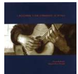
Música española para dos guitarras