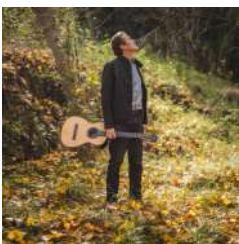
Camino y cuerda