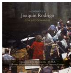
Homenatge a Joaquín Rodrigo