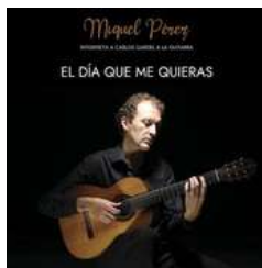
El día que me quieras