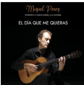
El día que me quieras