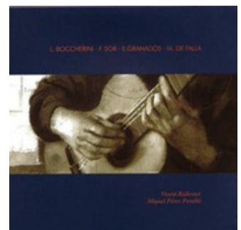
Música española para dos guitarras