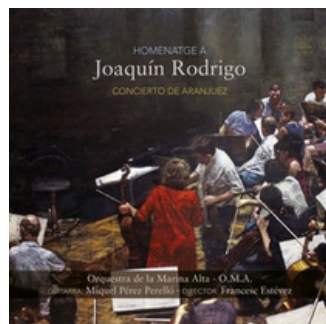
Homenatge a Joaquín Rodrigo