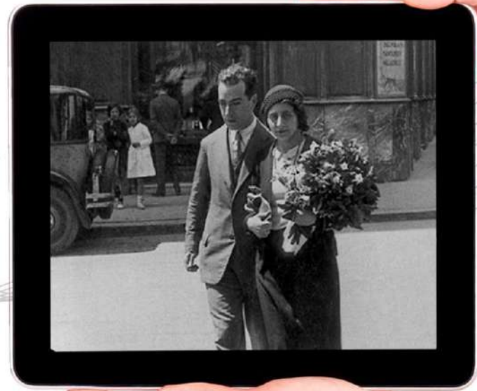
Joaquín Rodrigo i Victoria Khami su esposa.

Es per aquest motiu que hem optat per buscar empreses amb sensibilitat per l'activitat artística, que estiguen interesades en invertir i fer possible aquest cd.